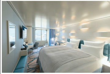
HANSEATIC nature Garantie-Außenkabine KAT. 1 SILBER