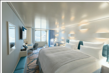
Silber Smart-Kat. 1-2 Garantie-Außenkabine