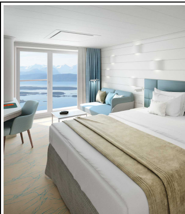
Silber Garantie-French-Balcony Kat. 5