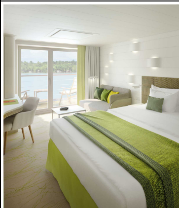
Balkonkabine, KAT: 6, ca. 27 qm, Deck 6 und 7