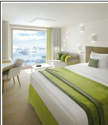
Panoramakabine, KAT: 2, ca. 21 qm, Deck 4 und 5