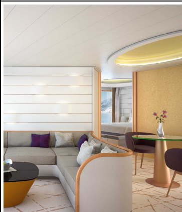
Grand Suite, KAT: 10, mit Veranda, ca. 71 qm, Deck 6 und 7