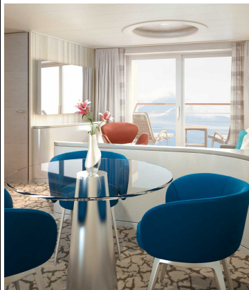
Junior Suite, KAT: 9, mit Balkon, ca. 42 qm, Deck 6 und 7