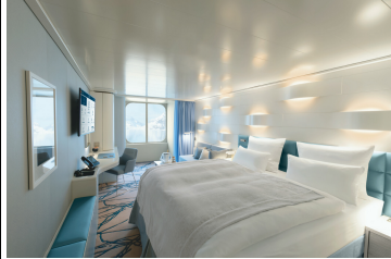
Silber Garantie Außenkabine Kat. 1