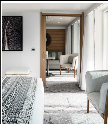
Deluxe Suite Deck 6