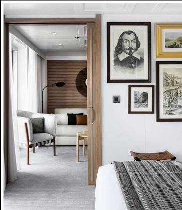
Le Dumont-d'Urville Owner's Suite