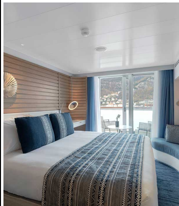
Le Dumont-d'Urville Deluxe Kabine