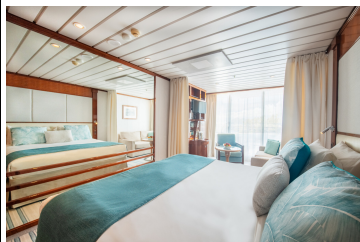
Veranda Kabine B