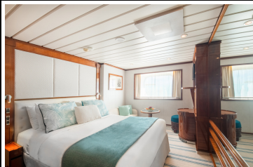
Window Kabine E