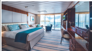
Veranda Suite A