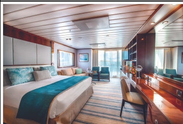
Grand Suite GS