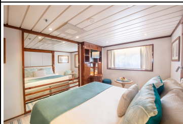
Porthole Kabine F