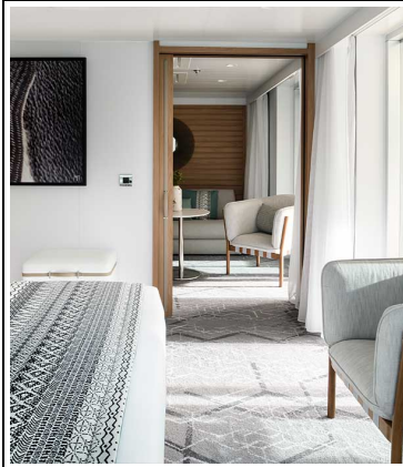
Le Jacques Cartier Grand Deluxe Suite Deck 5