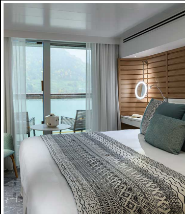
Le Jacques Cartier Prestige Kabine Deck 4