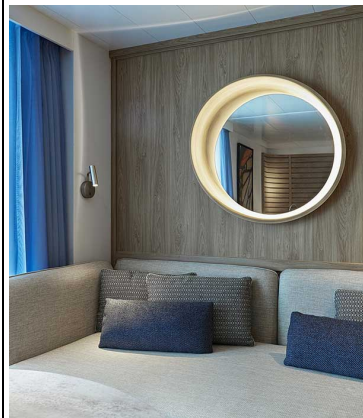
Le Jacques Cartier Privilege Suite Deck 5