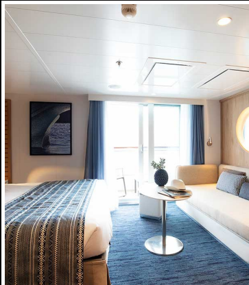
Le Jacques Cartier Deluxe Suite Deck 6