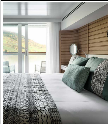
Le Jacques Cartier Prestige Suite Deck 5