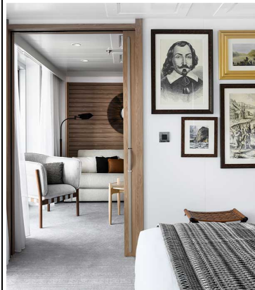
Le Jacques Cartier Owner's Suite