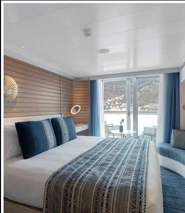
Le Jacques Cartier Deluxe Kabine